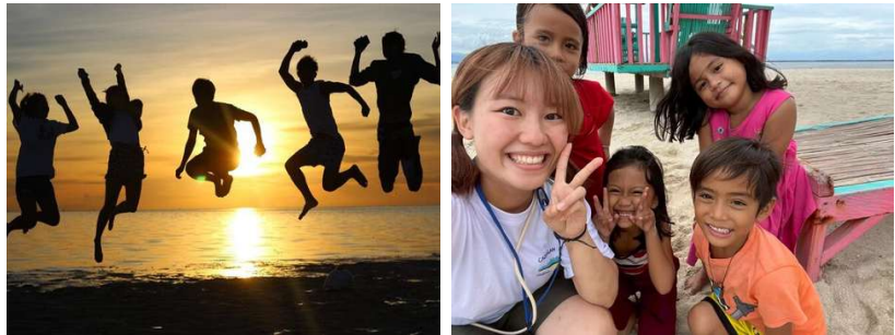
ご旅行条件書 (抜粋)